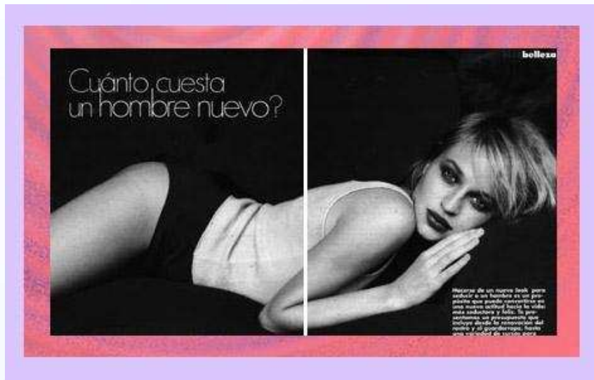
(Revista "Elle", año 2000)

"las mujeres son el mejor regalo que Dios ha hecho a los hombres" (Berlusconi)